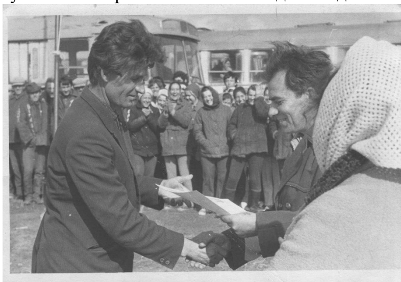
На полевых работах

Личные качества, а это, прежде всего, хорошие организаторские способности, порядочность и огромное трудолюбие, проявились и в его административной работе.