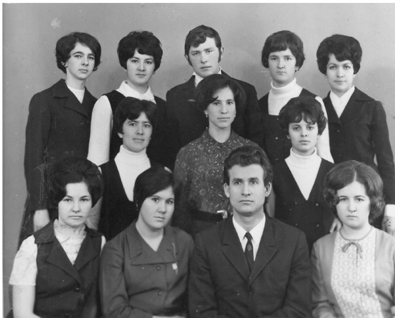
4 курс, отделение немецкой филологии, 1972г.

Конференции, курсы повышения квалификации, языковые стажировки - это тот особый мир, в котором возникают новые идеи, апробируются результаты научных изысканий, завязываются долгие и прочные контакты с коллегами и единомышленниками.