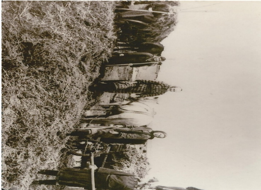
Женщины выполняют мужской труд