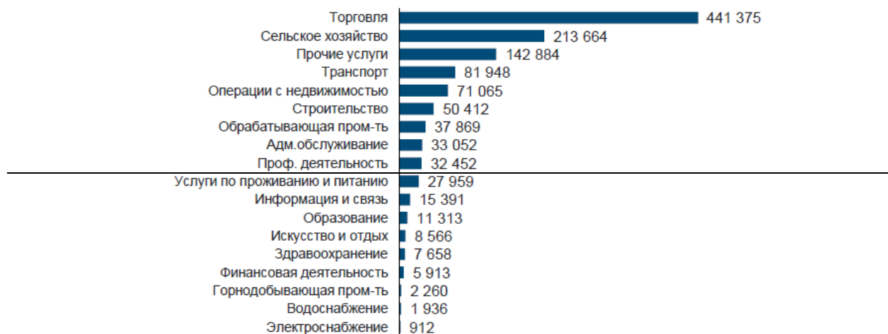
Рисунок 2. Действующие субъекты МСП по отраслям на 1 января 2017 года.

По данным Национального доклада о развитии предпринимательской активности в Республике Казахстан за 2016 г., подготовленного Национальной палатой предпринимателей РК «Атамекен», 99,8% всех предпринимателей относятся к субъектам малого и среднего бизнеса.