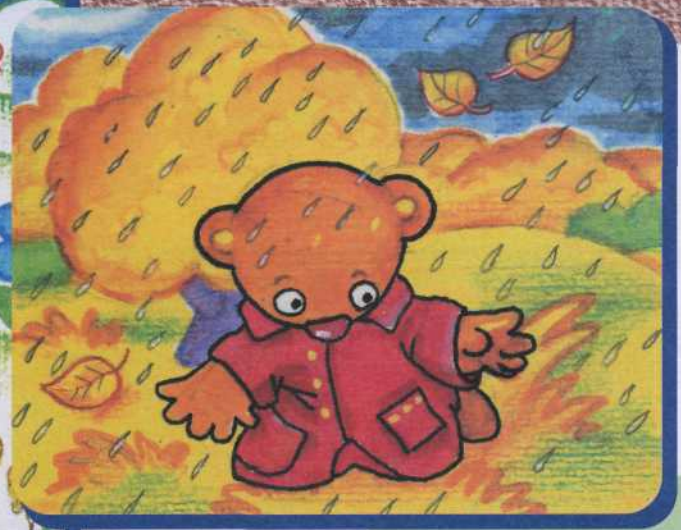
Illustrationen: Darja Gontscharowa

Im April sind kleine Blätter an den Bäumen. Die Frühlingsblumen blühen und die Vögel singen. Teddy sammelt Pilze und pflückt reife Äpfel.