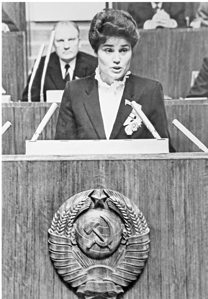
1984 г. «Я выступала в Совете национальностей в Кремаёвском Дворце съездов. Рассказывала о положении в области, о своей работе, о депутатских делах»