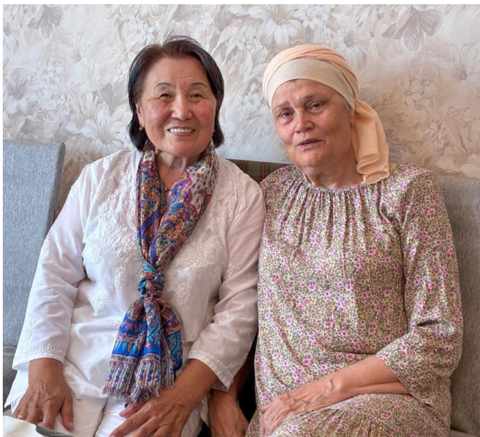
2025 г., 9 августа. Со сватьёй Жамал

Сейчас мы с ней полноценные пенсионеры, сами распоряжаемся своим временем, часто вместе отмечаем семейные праздники, юбилеи, участвуем и в жизни наших внуков. Я рада, что судьба послала мне такую сватью!