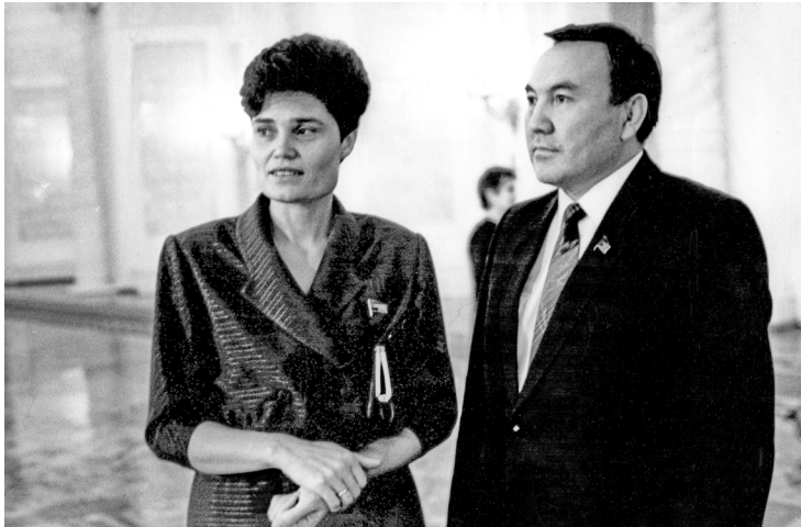
1984 г. Депутаты Верховного Совета СССР Наталья Геллерт и Нурсултан Назарбаев, председатель Совмина Казахской ССР. Георгиевский зал Кремля. «Я тогда не могла знать, что Нурсултан Абишевич станет президентом страны. Мы обычно и просто общались, вот как я с вами сейчас»