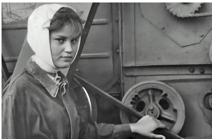
1969 г. Наташа положила руку на ходовой ремень привода коробки комбайна «СК-5». Впервые она сядет за руль зерноуборочной машины только в 1976-м

— Что такое труд механизатора? Он начинается в пять утра, и ты возвращаешься в полночь. Мы работали и днём, и ночью. Менялись, потому что тяжело постоянно ходить в ночные смены. Работали так: неделю механизатор выходит в день, следующую неделю – в ночь.