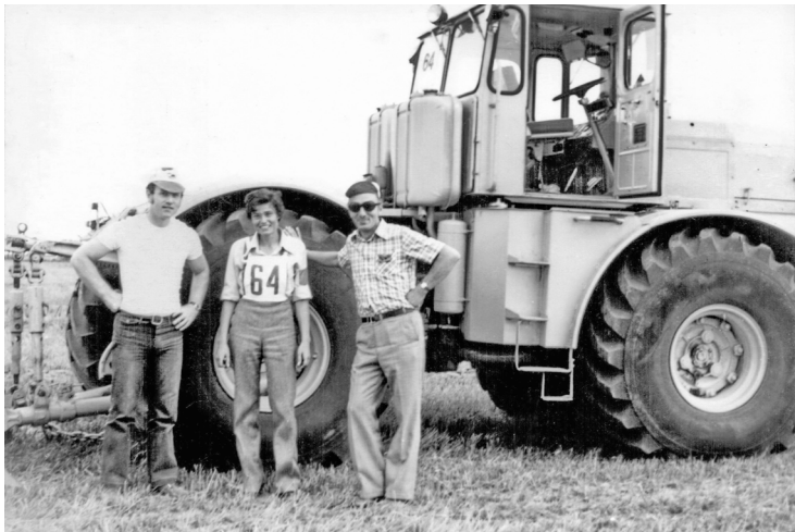
1979 г., Чехословакия. «Проводились соревнования пахарей из стран-членов СЭВ. Здесь я с судьями моего участка. Они замеряли глубину обработки»