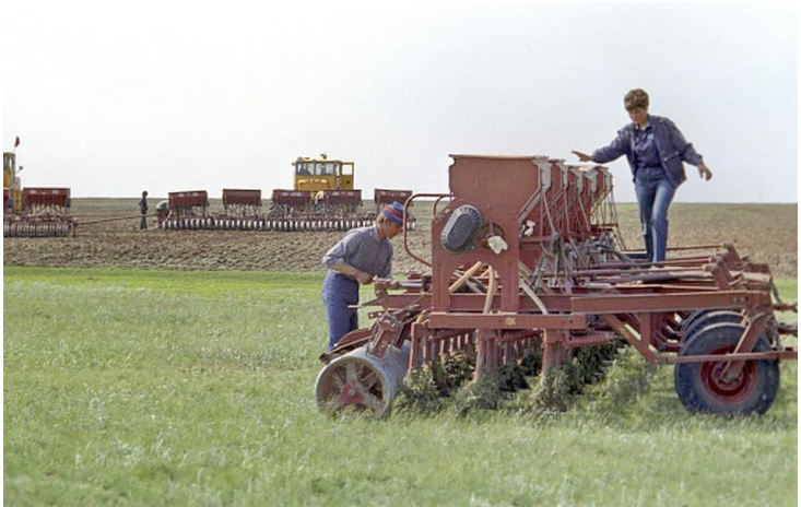
1980 г. С братом Артуром у агрегата СЗС-2,1 из 5 сеялок, регулировка и настройка перед посевом